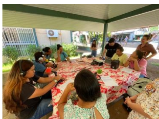
Une Webradio en direct avec NRJ