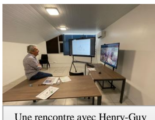
Une rencontre avec Henry-Guy PARQUET, dessinateur de presse, en distanciel