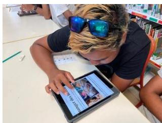
Les infos à décrypter