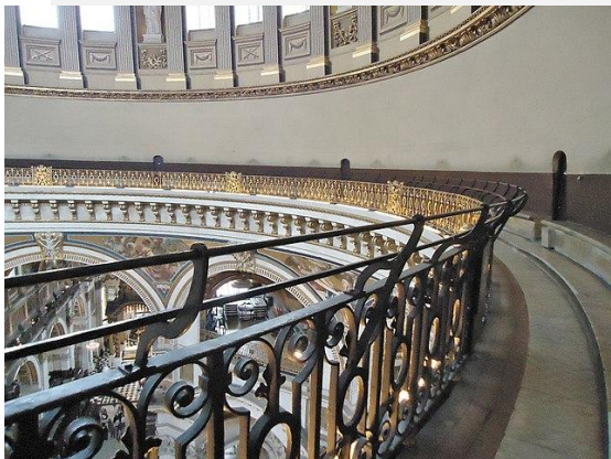
Cathédrale Saint Paul