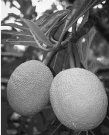
Deux fruits de l'arbre à pain