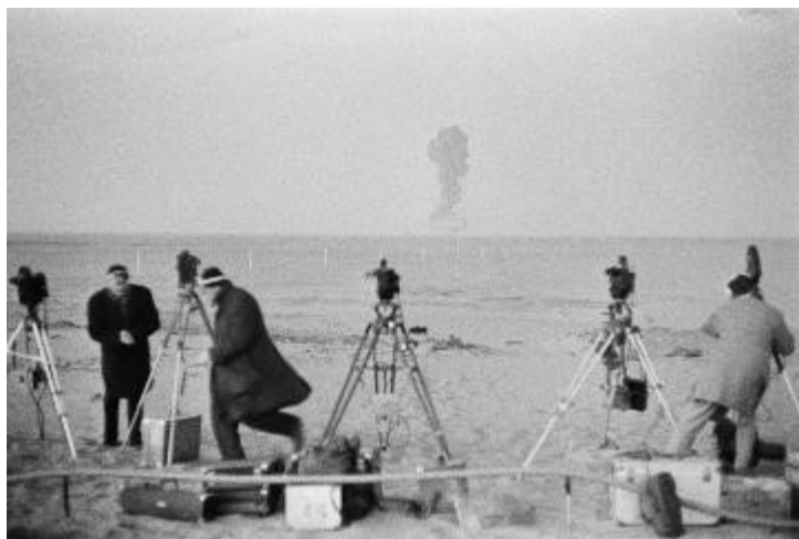
Photo prise le 27 décembre 1960 près de Reggane dans le sud algérien, pendant la 3 e explosion de la bombe A française dans le cadre des essais nucléaires aériens. C'est à Reggane que fut expérimentée la 1 ère bombe atomique française le 13 février 1960.

Essais souterrains dans le massif du Hoggar à In Ekker (1961 Sahara algérien).