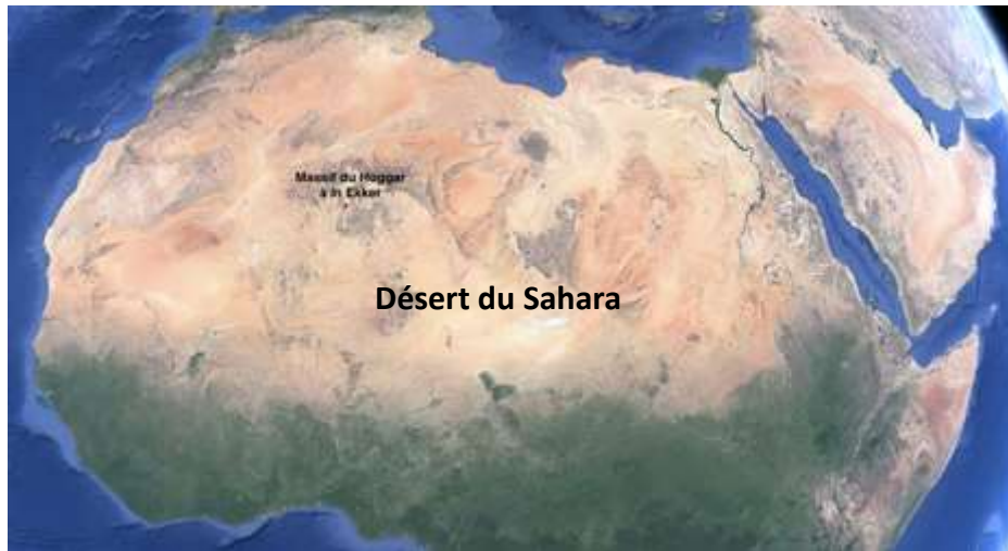
Afrique du nord (vue de l'espace, image google earth)

Pourquoi le choix de ces lieux pour expérimenter l'arme nucléaire ?