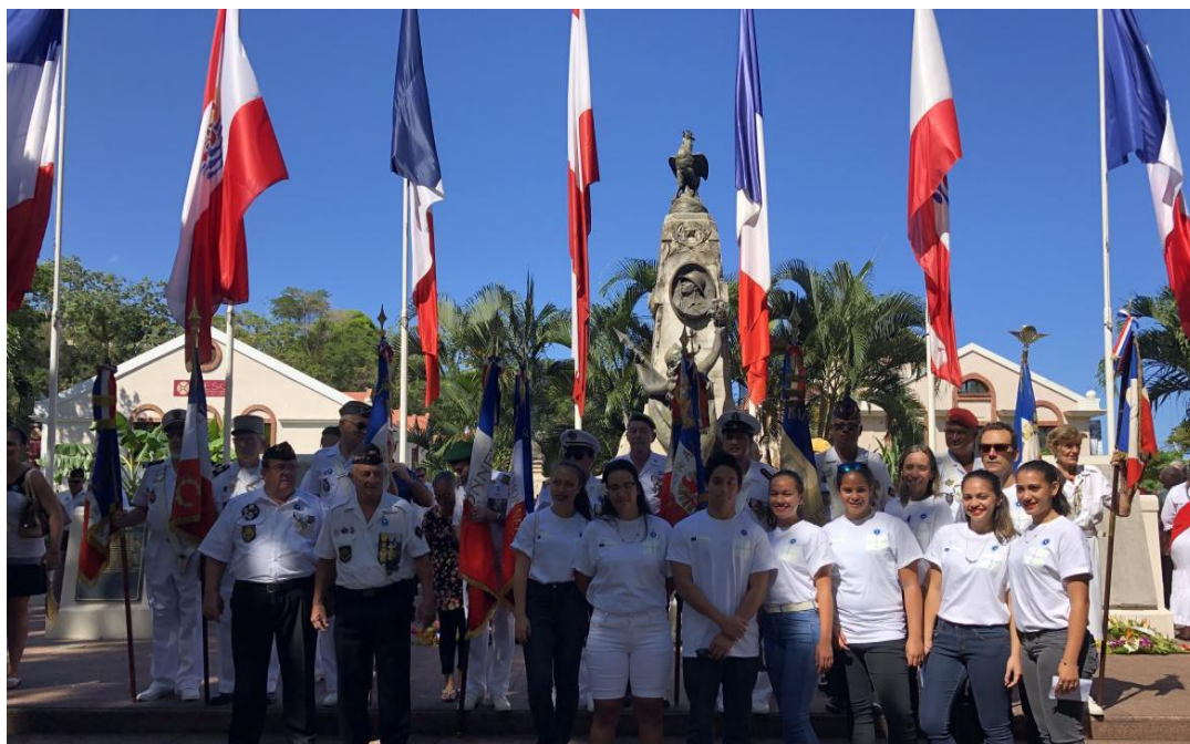
Cérémonie du 11 novembre 2018 : Monument aux morts de Papeete