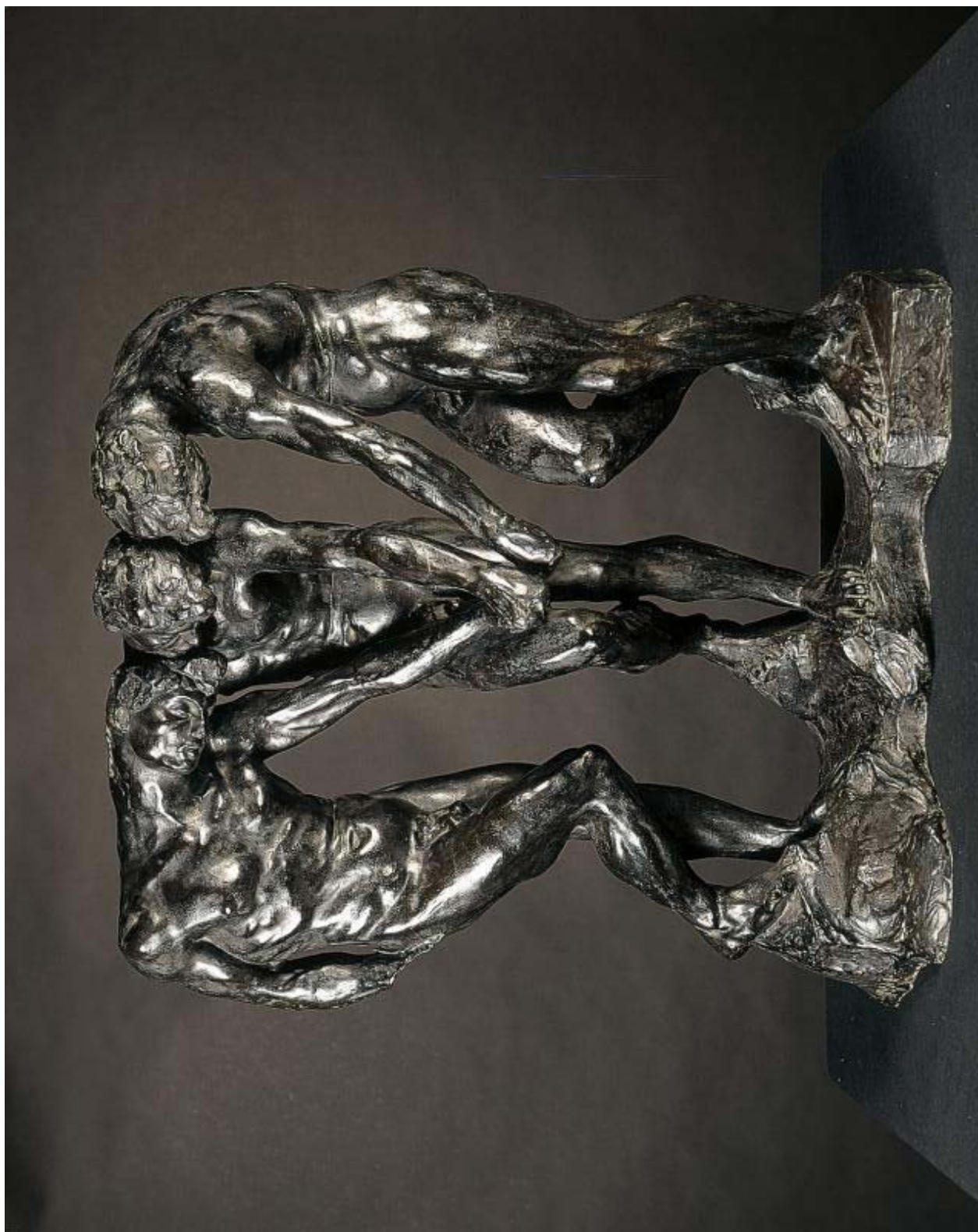
Auguste RODIN, Les Trois ombres , avant 1886, bronze, H. 97 cm ; L. 91,3 cm ; P. 54,3 cm. Musée Rodin, Paris.