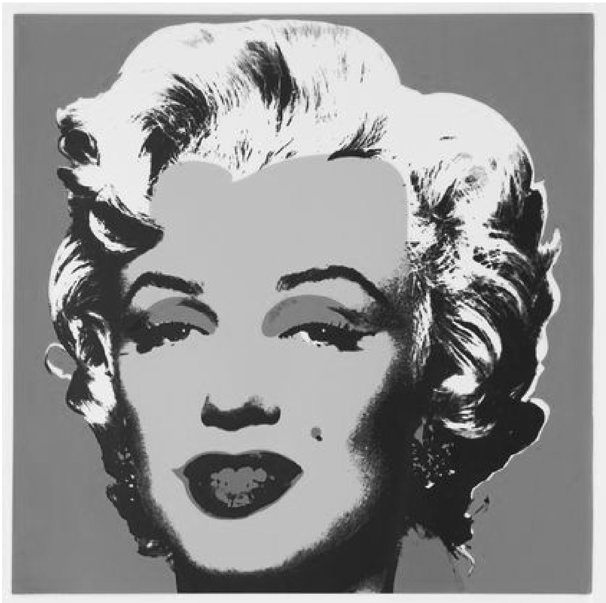
Document n° 2 : Andy Wahrol, « Marilyn Monroe » 1967 ; H91.5 x L91.5 cm. Un exemplaire parmi une série de dix sérigraphies éditées par Factory Additions.