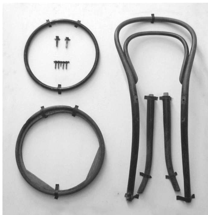
Document n° 1 : Michael Thonet, « chaise n°14 », 1859, hêtre massif courbé, assise cannée, dimensions : H84 x L43 x P52 cm.