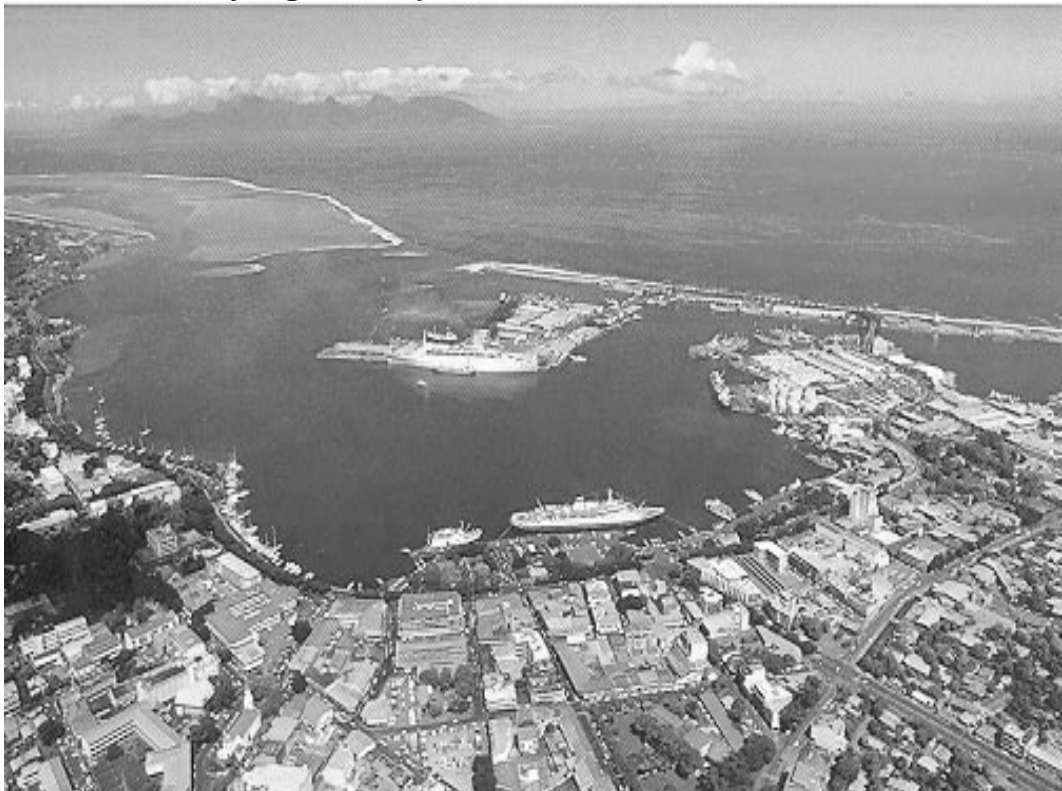
Paysage de Papeete, années 2000

1- Quelle est la nature de ce document ?