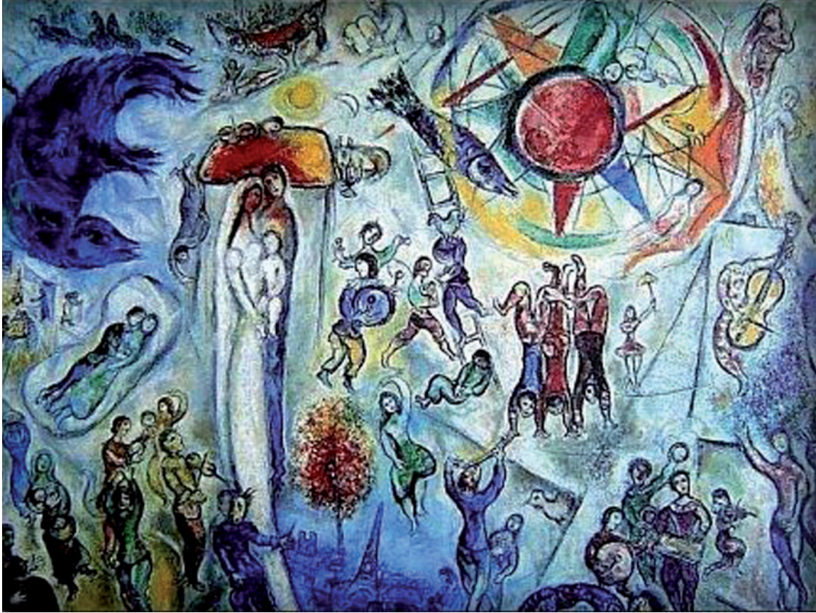
Marc Chagall, La Vie , 1964, huile sur toile, Fondation Maeght, Saint-Paul-de-Vence.