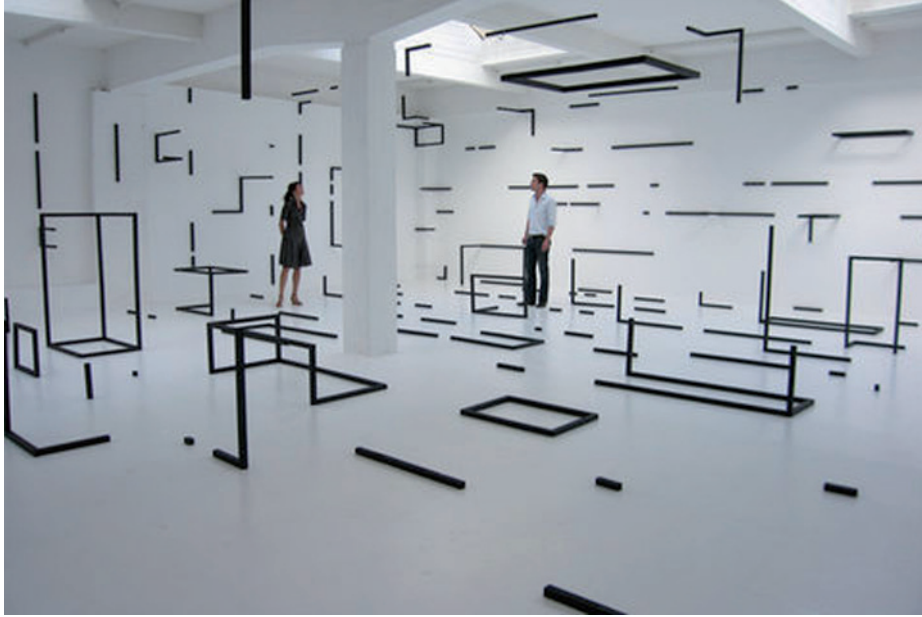
Esther Stocker, Abstract thought is a warm puppy , 2008, installation, 10,75 x 12,10 x 3 m, CCNOA, Bruxelles, photo : Sacha Georg.