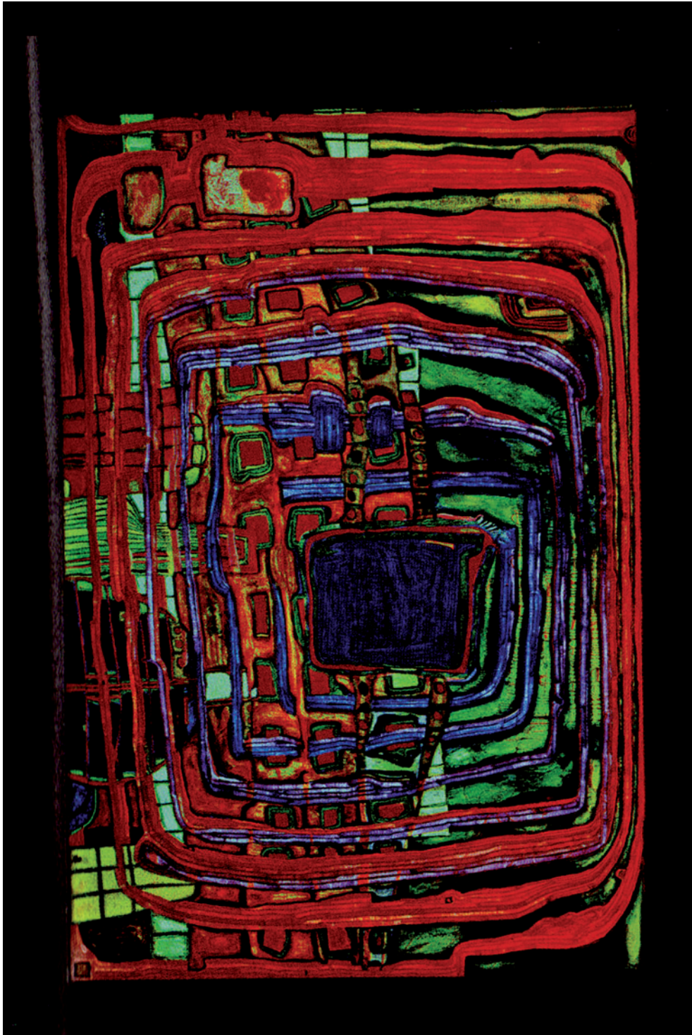
Friedensreich Hundertwasser, Le je ne sais pas encore , 1960, technique mixte, 130 x 195 cm, Kunsthaus, Vienne.