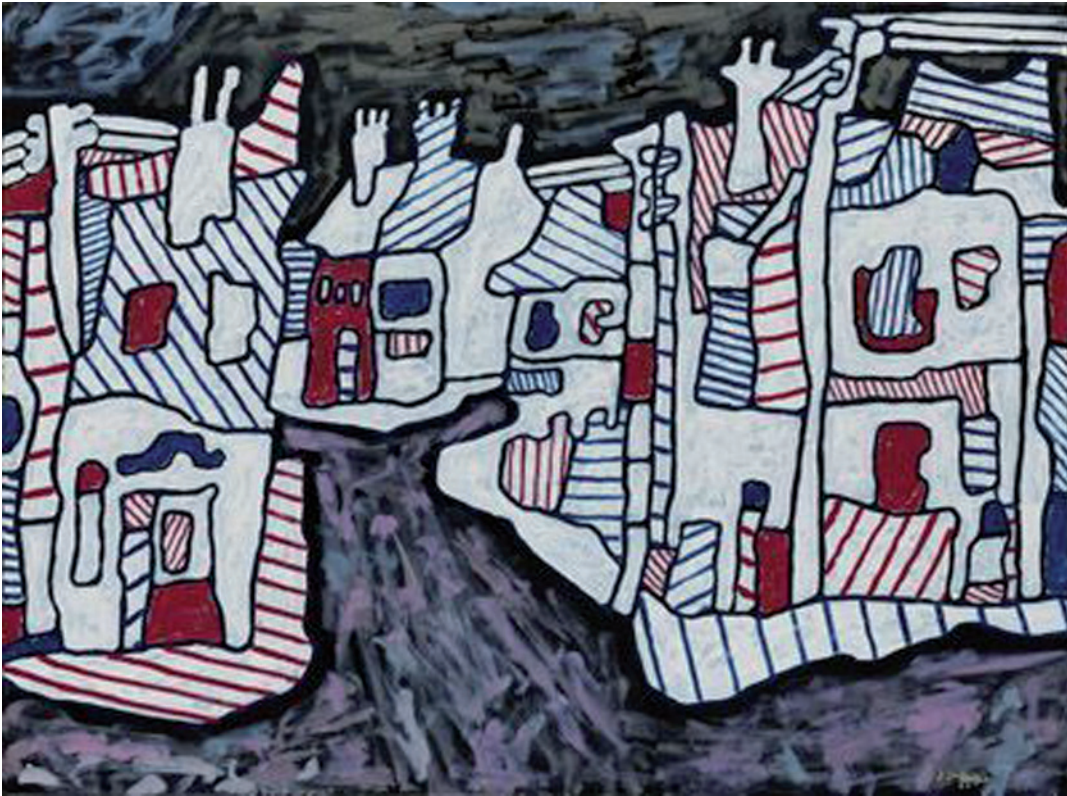
Jean Dubuffet, Le Village fantasque , 1964, 97,2 x 130,2 cm huile sur toile, collection privée.