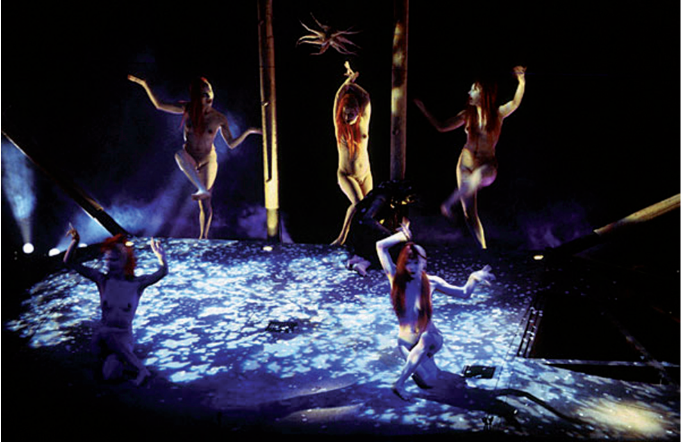
Bacchantes d'après Euripide, mise en scène d'Omar Porras, Théâtre Forum Meyrin, Genève, 2000.