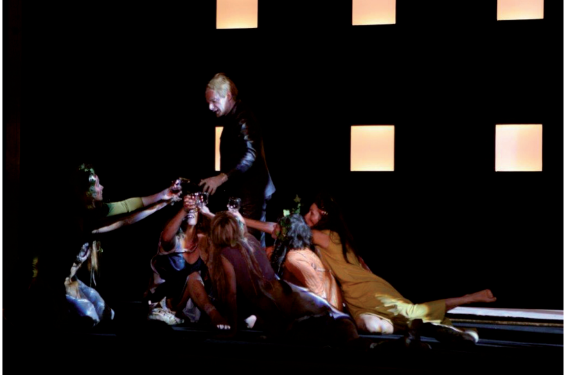
Les Bacchantes d'Euripide, mise en scène d'André Wilms, Comédie- Française, 2005 © Marthe Lemelle.