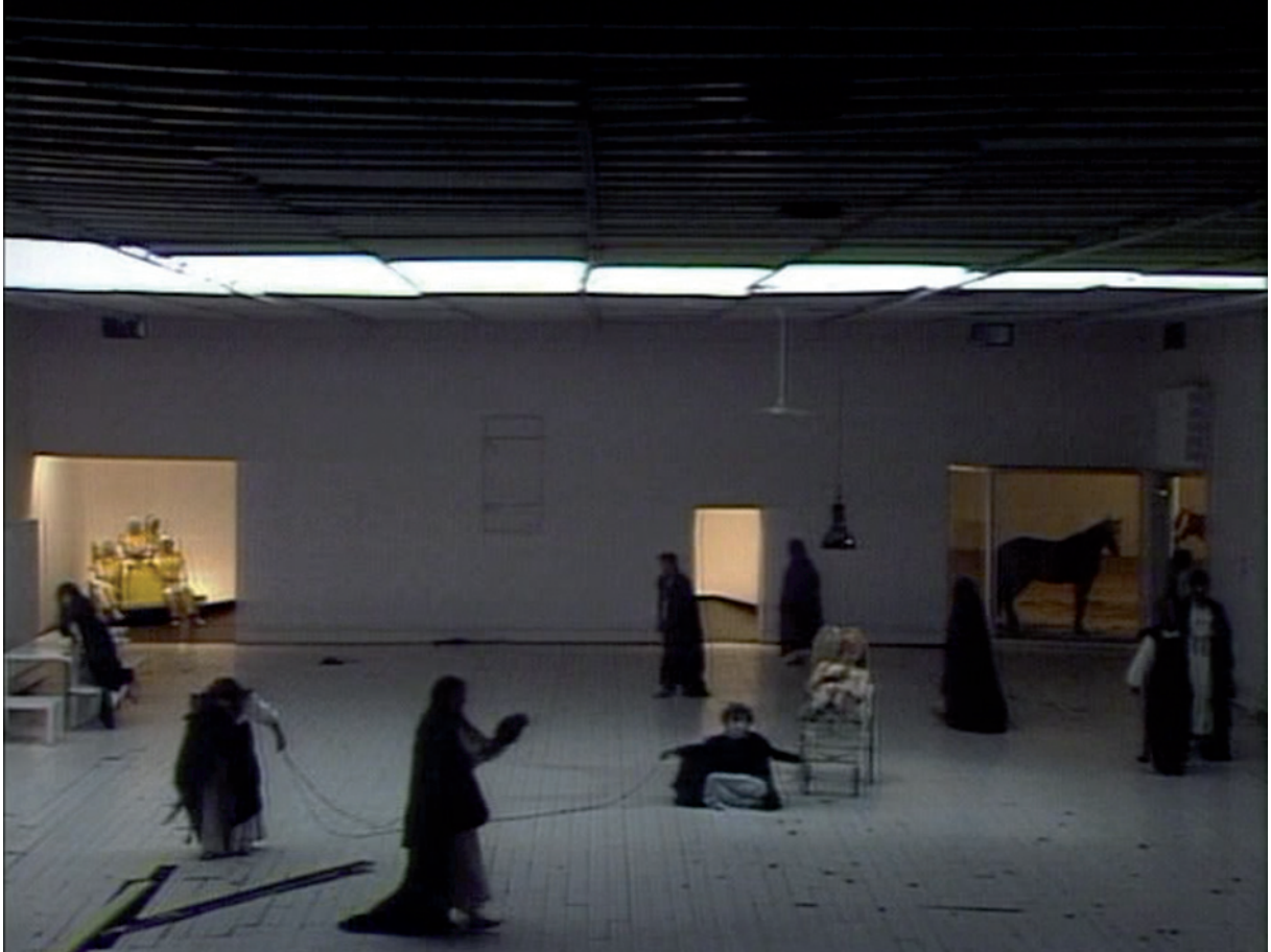
Die Bakchen d'Euripide, mise en scène de Klaus Maria Grüber, Schaubühne, Berlin, 1974.