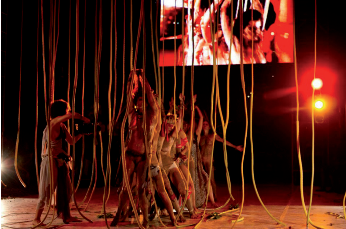
As Bacantes , d'après Euripide, mise en scène de José Celso Martinez Correa, Théâtre de Liège, 2011.