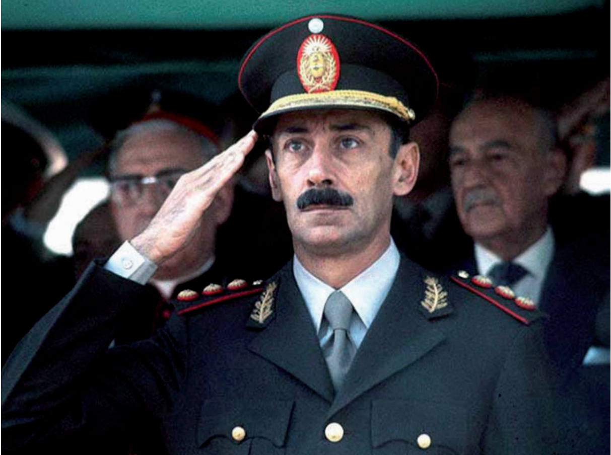
Photographie du dictateur argentin Videla, The Independent , dimanche 10 novembre 1973.