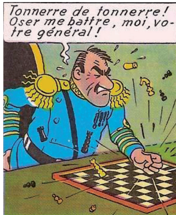
Hergé, Le général Alcazar, Tintin et les Picaros , Casterman, 1976.