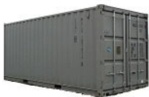
CONTENEUR 20' DRY

Cette expédition se fait en FCL/FCL à l'aide d'un conteneur 20' dry :