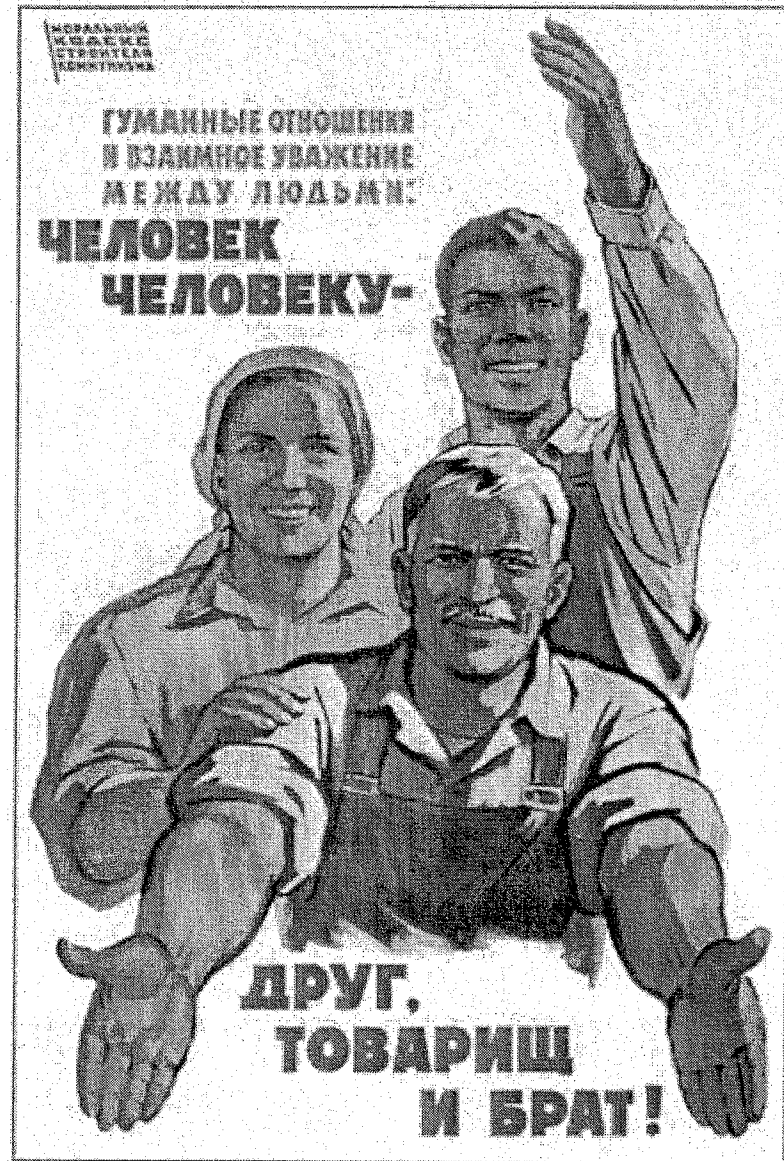
Affiche de B. Soloviev, 1962.

Cette affiche illustre le 6 e point du "Code moral des bâtisseurs du communisme", portant sur "les relations humaines et le respect mutuel au sein du peuple", adopté par le XXII e Congrès du PCUS en 1961.