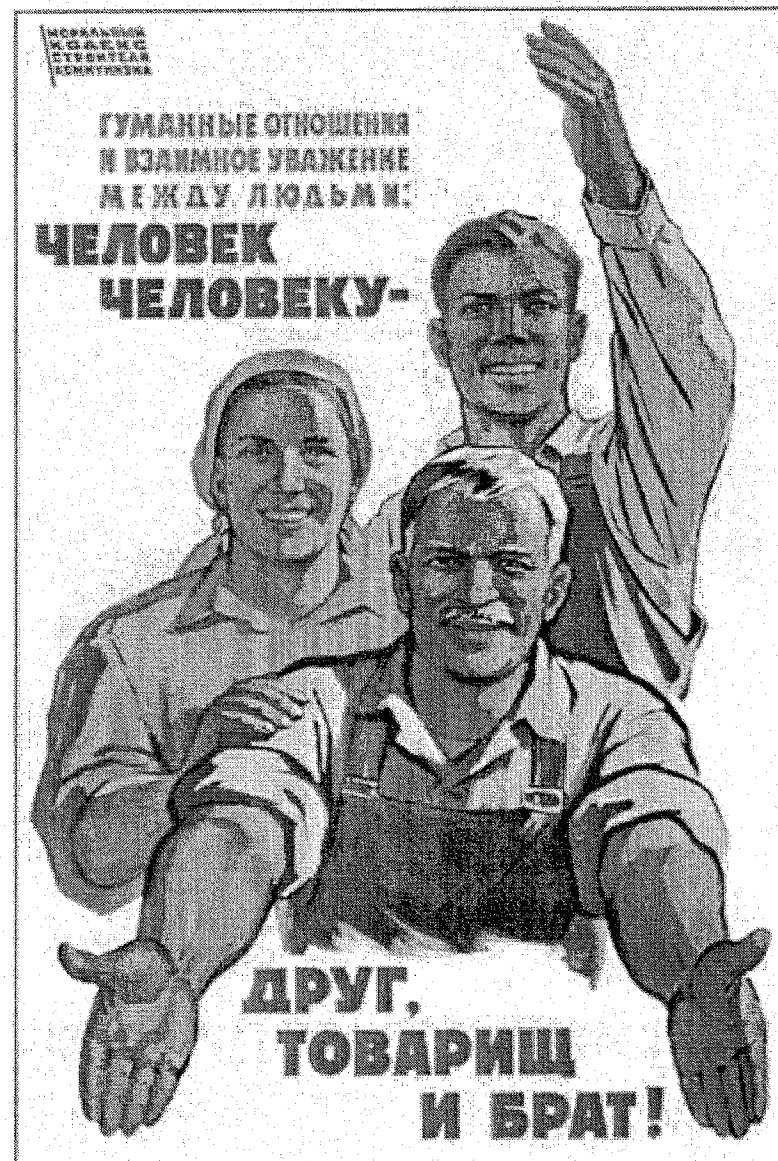
Affiche de B. Soloviev, 1962.

Cette affiche illustre le 6 e point du "Code moral des bâtisseurs du communisme", portant sur "les relations humaines et le respect mutuel au sein du peuple", adopté par le XXII e Congrès du PCUS en 1961.