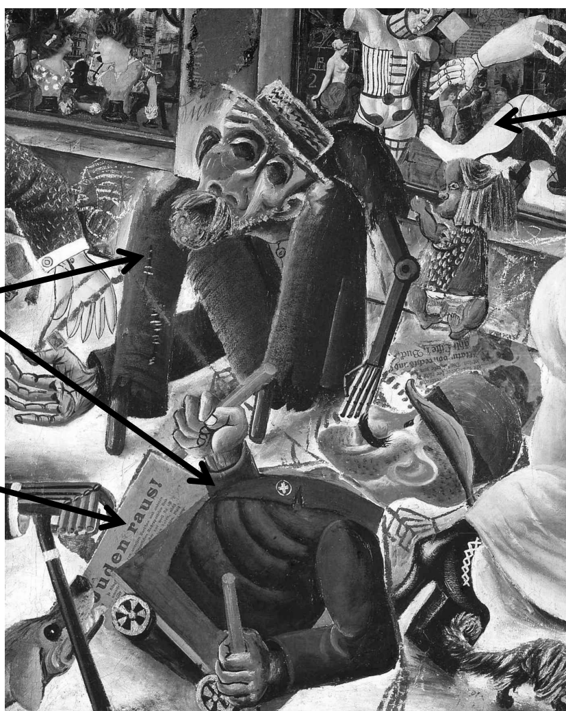
La Praguestrasse (Rue de Prague)- Otto Dix* (1920)