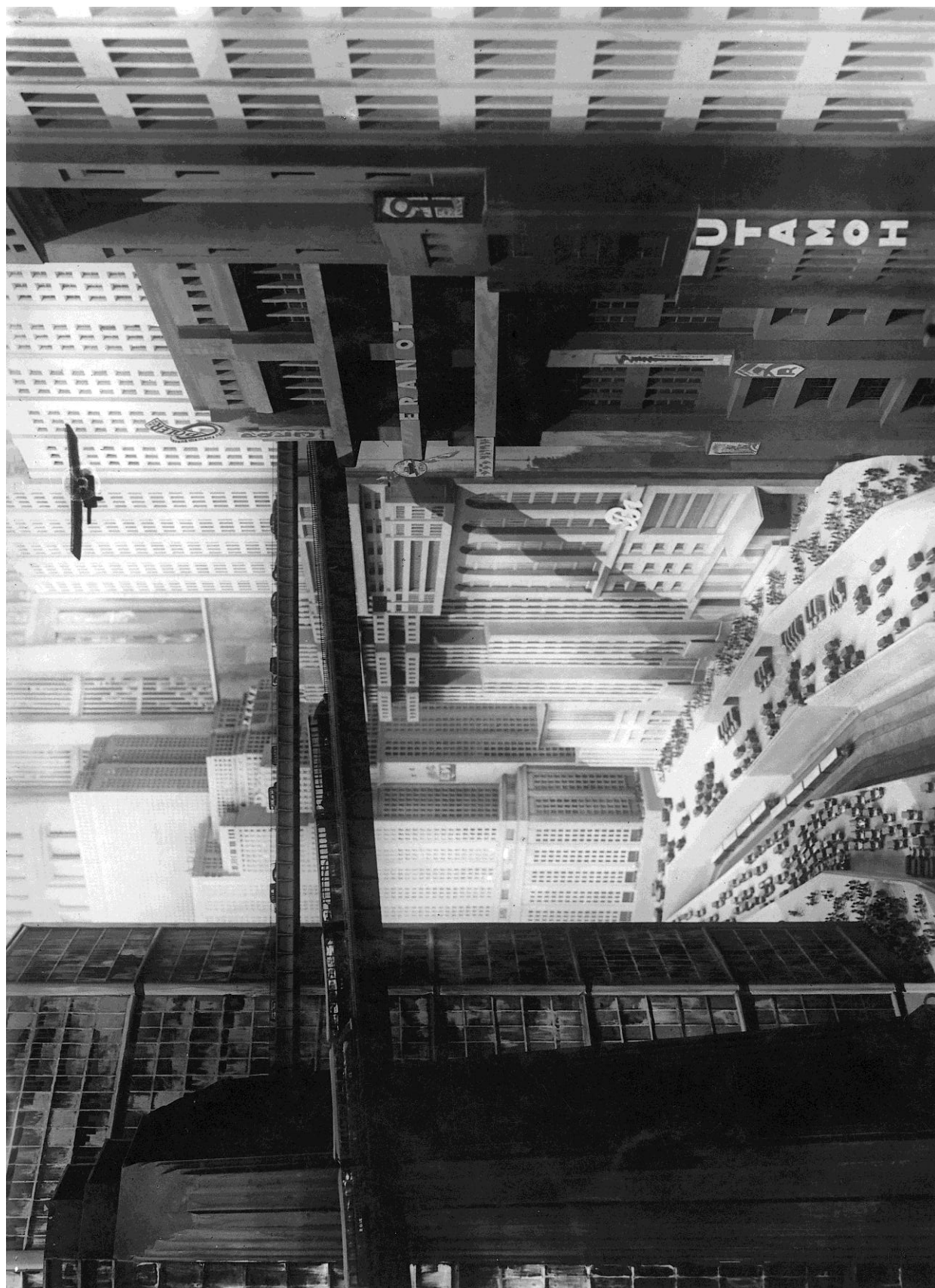
Document 1 : Fritz LANG, Metropolis , 1927, photogramme