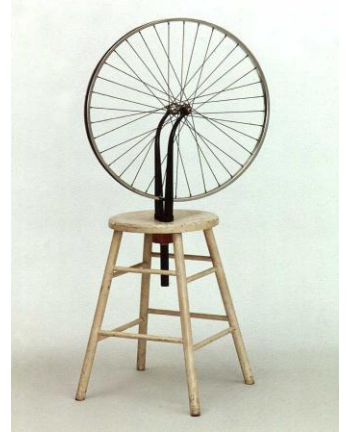
Marcel DUCHAMP, Roue de Bicyclette, 1913

Question 2 : (2 points ; 0,5 point par bonne réponse)