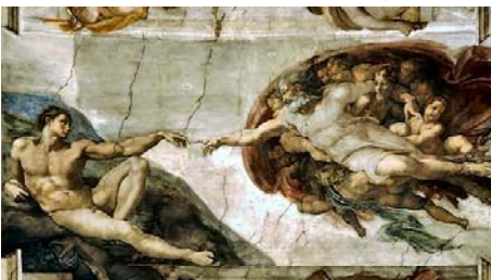
"La création d'Adam" détail de la voûte de la Chapelle Sixtine, vers 1508

réponse A = cette peinture est de Michel Ange