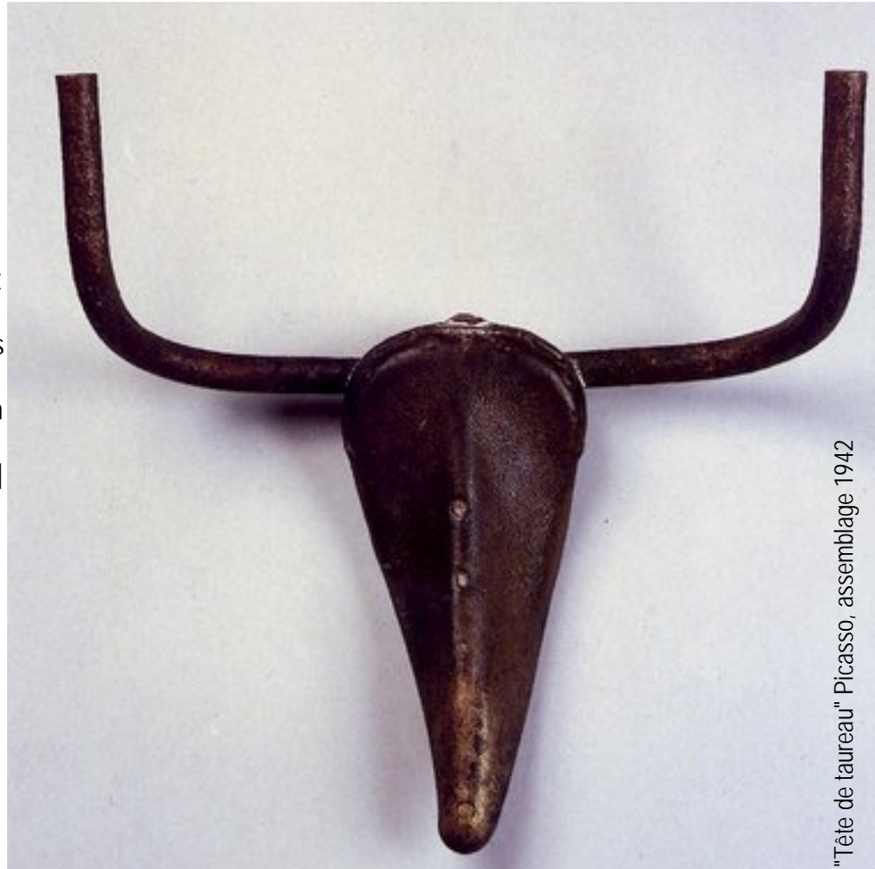
"Tête de taureau" Picasso, assemblage 1942