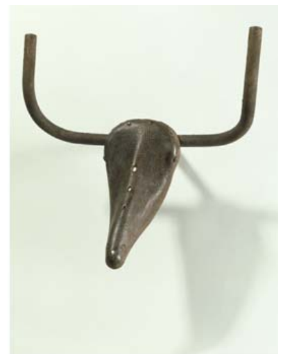
"Tête de taureau" Pablo Picasso, assemblage (selle et guidon) 1942